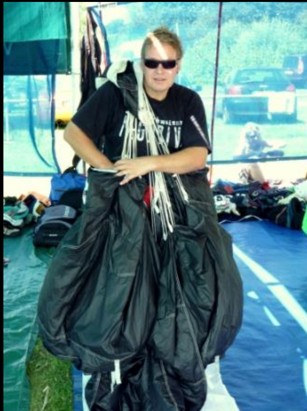
05.08.2009 Packjob am Herrenteich