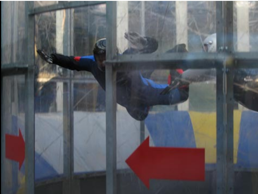
09./10.02.2008 Tunnelcamp Zürich