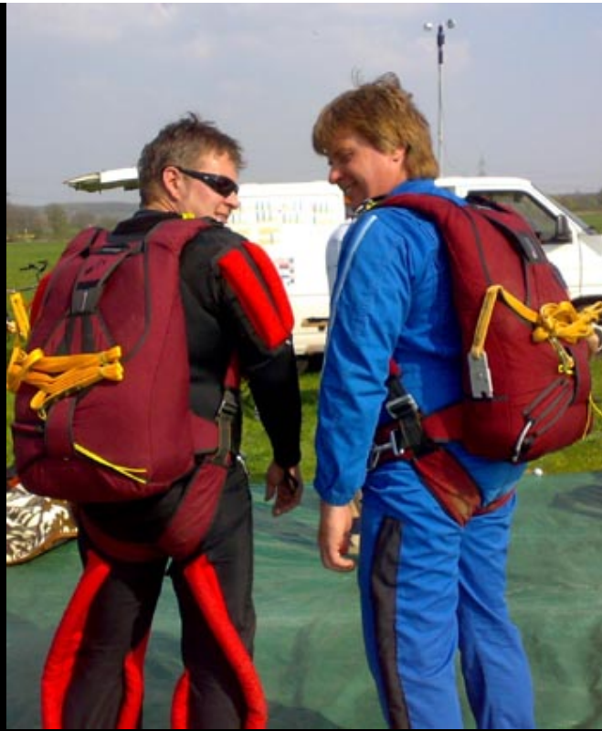
10.04.2009, nicht der neue Schülerkurs ;-)