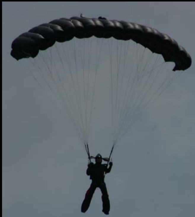
08.06.2008 Außenlandung in Rot